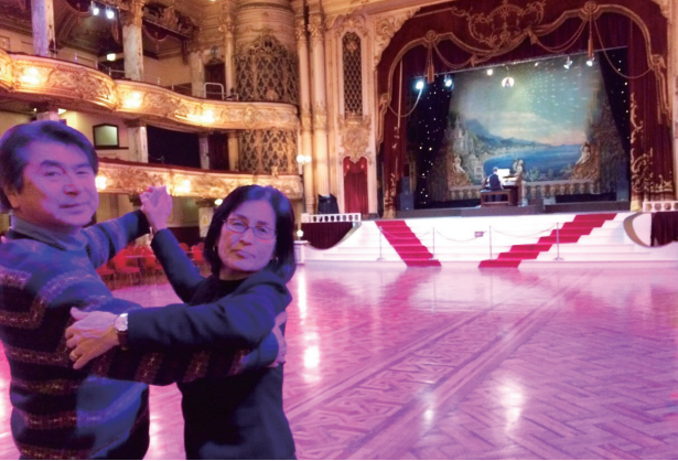
ブラックプールのダンスホールでパートナーの奥さまと！(2016年)

「舞踊と音楽は人間自身の発明した最初にして最も初期的な快楽である。神の見えざる手の名言で知られるアダム・スミスの芸術論の一節で、イングランド北西部の保護地、ブラックプールのダンスホールに刻まれている言葉でもある。