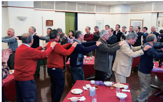
全員で「中大節」に合わせて会場を練り歩いた