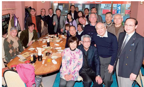
二次会は20名以上の参加者で盛り上がりました。