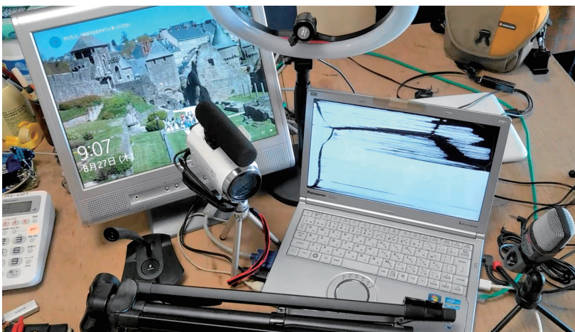
撮影・編集機材。ノートパソコンは液晶画面が壊れている。中央にマイクロフォン付きのハンディカム。下に三脚。上の円いライトで顔を美しく照らす（笑）

親切な店員に撮影機材の予算を伝えて教えるを請い、ソニーのハンディカム、カメラに取り付ける専用マイク、スマートフォン、三脚の三点セット合計73,569円で購入した。のちほとんどにナレーション録音用の高性能マイク、スマートフォン6,498円も必要になった。安いのはライブが入ってダメだ。