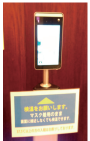
「正常です」と言われて入館。現代の閑所です。