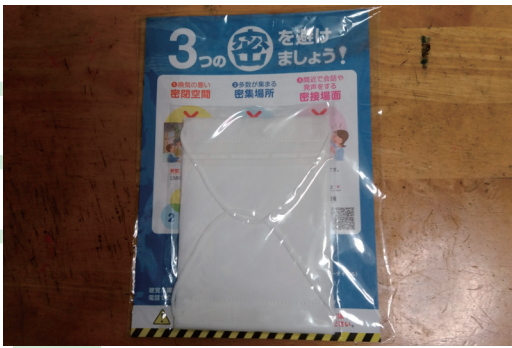
電車の中で着用している人を見たことが無いアベノマスク

カメラマンとして直接クライアントと接する僕の仕事の殆どが今はリモートで撮影が行われるようになった。