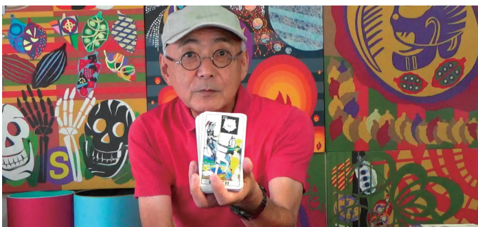
自宅室内で背景を自作絵画でしつらえて自撮り。光線が難しく、メガネはライトに反射するので要注意