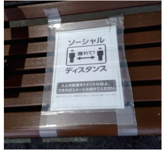
今年の流行語になりそうな「ソーシャルディスタンス」

2月末からの新型コロナウイルス感染拡大で学校の一斉休校に始まり、春のセンバツ高校野球中止、オリンピックの1年延期、4月には「緊急事態宣言」が発出されて社会全体が異常な状態になってしまいました。そんな中で、今までと違った生活方法も見えてきました。会員の皆様からそれぞれの生き方を書いていただきました。