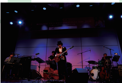
感染防止対策を徹底して10月25日に無事開催!!