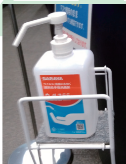
どこもかしこも消毒で、手が荒れてしまいました。

去年の台風で受けた電気の無いサバイバルな生活も覚えておかなければ…。 秋風が金木犀の香りを運ぶ。小動物が食べ残した栗を拾い、栗の渋皮煮を作った。鳥獣とも共存共栄？ 負けるもんか！