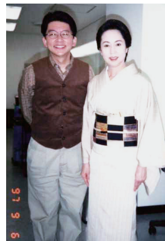
山本陽子さんととのツーショット(1997年)

女優は美しさと若さを常に求められる。これも仕事。芸だけではなく「夢」も売る。実は山田さんの頭皮は傷だらけ。常に張りのある肌を薬や化粧品ではなく美容手術で維持していたのだ。残酷だがこれも女優ならではの人生なのだ。隠すことはしなかつた。凄絶な女優魂と老齢になっても美を求められ続ける職業の宿命だと教えられた。2000年。文化勲章を受けた直後、やはり正月の私の特別番組にも快く出演してくれ、清元を語った。父は新派の俳優、山田九州男。母は清元の師匠だった。日本舞踊、三味線など日本の伝統芸を少女時代しっかり叩きこまれ映画黄金時代から天下の二枚目、長谷川一夫の相手役として舞台進出、「五十鈴十種」など主演舞台を数多く勤め、そしてテレビへと時代の趨勢とともにトップ女優であり続けた人だった。