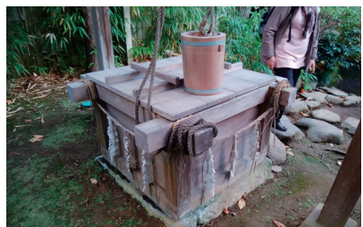
手児奈霊神堂(上)と真間の井