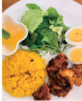
デビュー料理はターメリックライス、タンドリーチキン、ゆで卵、ベビーリーフ、梨ゼリー。トマトと卵のスープも提供。

先日、鴨川市の某カフェの依頼で、ワンダーシェフを務めました。自分の料理で料金をいただくのは初めてでしたので、心配と緊張で一杯でした。昼食時だけ私の料理を提供しましたが、二十食以上の注文がありました。ほぼ全部のお客様に感想をお聞きしましたら、皆さん口を揃えて「大変美味しかったです」とお褒めの言葉をいただきました。カフェからも今後ともお願いしますとの要請がありました。