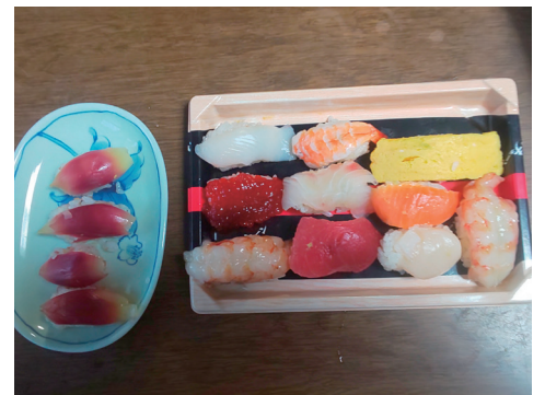
家族に握った寿司です。左の寿司はミョウガの甘酢漬けを握ってみました。

なくリクエストしてきます。「お父さんの料理は最高です。」と言われ、その気になって料理をしています。カフェでのワンダーシェフのメニューを考えると、家で三回は試作します。食品衛生責任者の資格も取得してあります。友人たちに店を開いたらとからかわれますが、私が店をやったら料金を取らないと思えますので、カフェのワンダーシェフで満足しています。